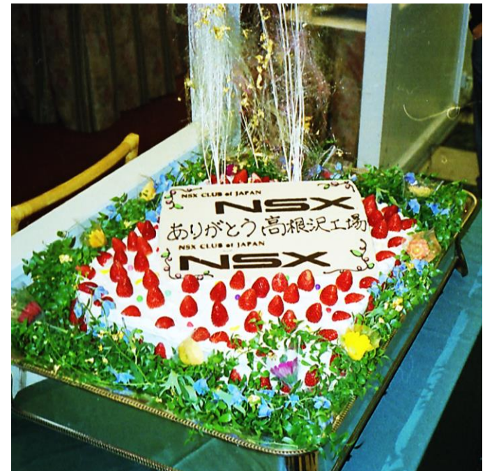
“ NSX ありがとう 高根沢工場2003 ” (from NSX CLUB of JAPAN )

”NSX30周年おめでとうございます。発売当時は社会人になったばかりで、ただあこがれの存在でした。ようやく最近になって中古ですが手に入れることが出来て、楽しくドライブしています。各種イベントに出席する度に多くの人の想いが詰まった車であることを実感します。このような車を世の中に出してくれた事に感謝するとともに引き続き楽しみたいと思います。”