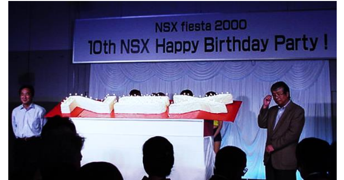
“ 10th NSX Happy Birthday Party! ” (NSX fiesta 2000 )