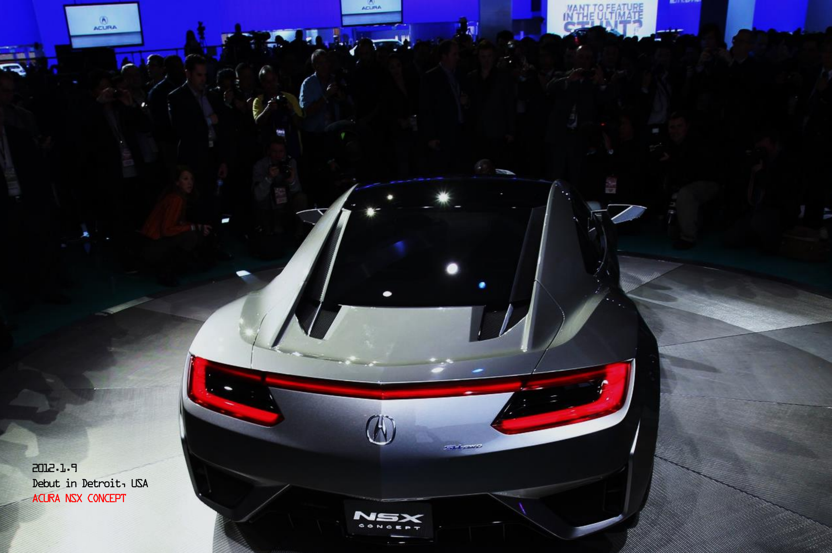
2012.1.9 Debut in Detroit, USA ACURA NSX CONCEPT