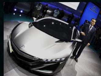
本田技研工業 前・代表取締役社長 Former Honda President and CEO