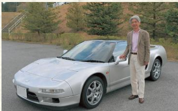
初代Honda NSX開発責任者 First Generation Honda NSX Large Project Leader

30年もの長い間のご愛顧と応援ご協力、有難うございました。そして、これからもよろしくお願い申し上げます。