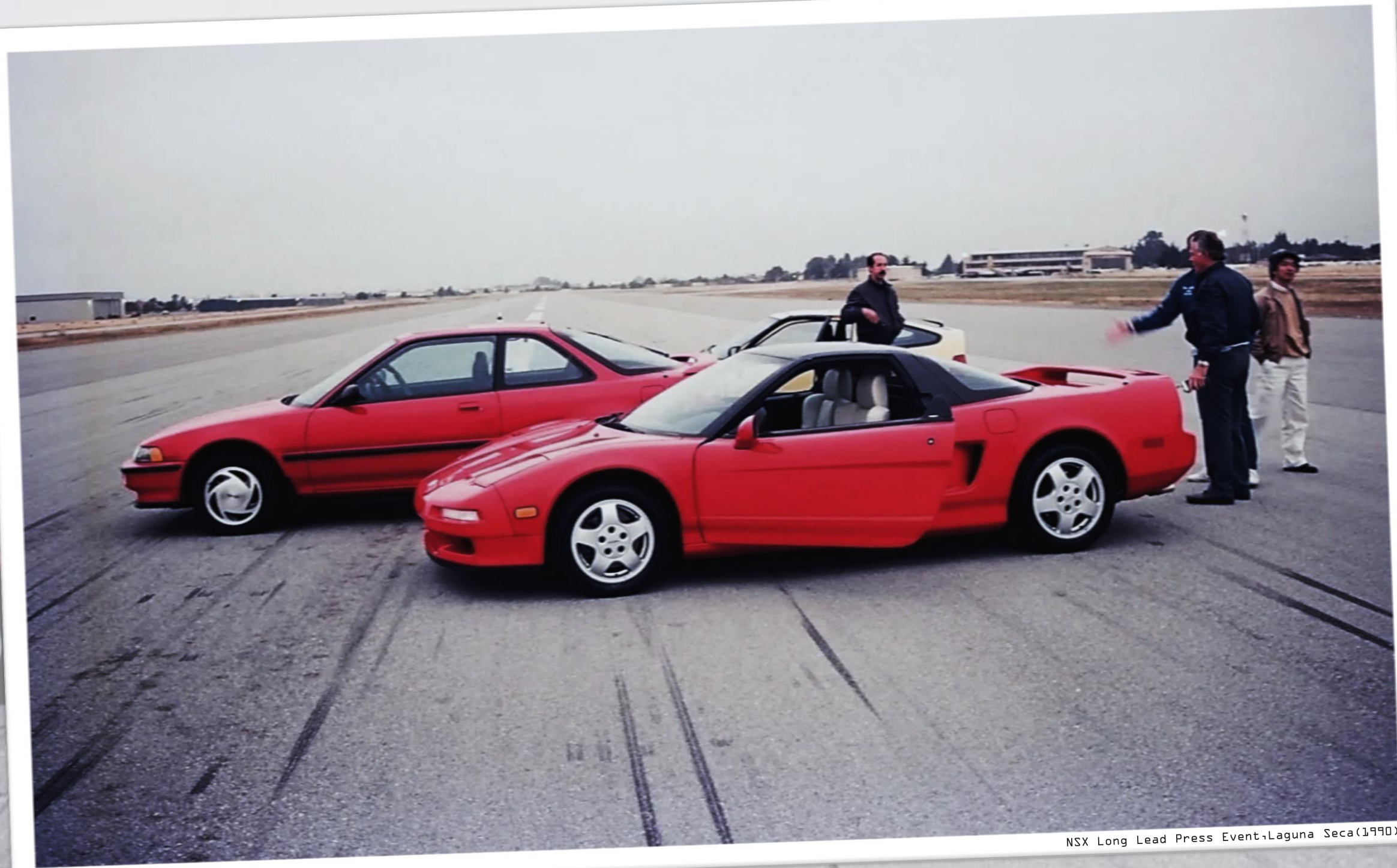
NSX Long Lead Press Event・Laguna Seca(1990)