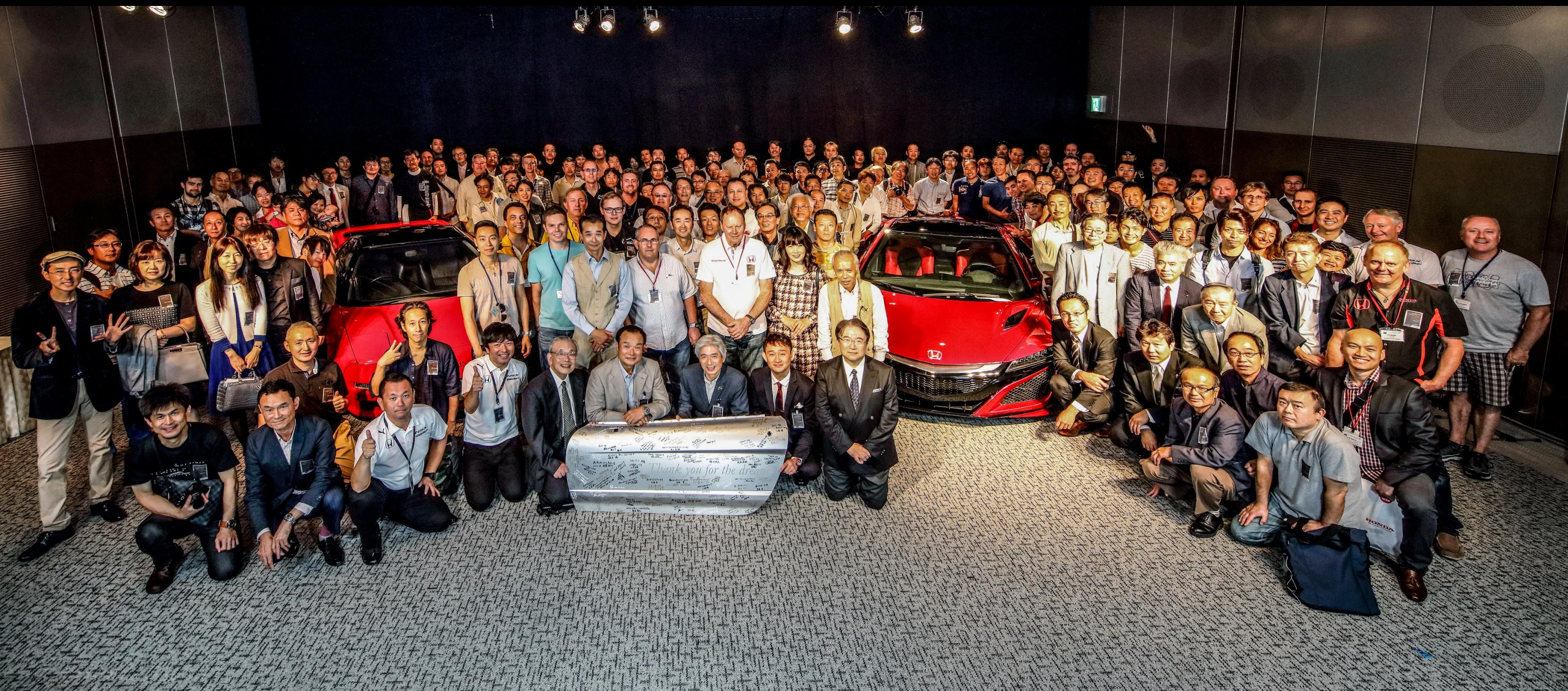
NSX 25th World Party, Honda Head Office (2015)