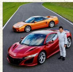
第二世代Honda NSX開発責任者 Second Generation Honda NSX Large Project Leader

We hope you will take this opportunity to join us in pursuing your dreams.