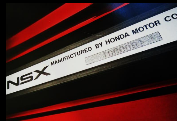
1990.9.13 Debut The 1st Generation NSX